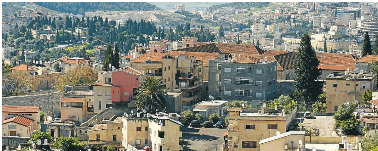
Vue over Nazareth, hvor "Jesu trail" begynder. I dag er det staten Israels største arabiske by med over 60.000 indbyggere. 35 procent er kristne, mens resten er muslimer.

derne gyldne som guld. Solen skinnede for øvrigt fra en skyfri himmel alle dagene og temperaturen blev hver dag 1 grad varmere og endte med 29 grader. Da deltagerne havde studeret "Saligprisningernes Bjerg", hvor Jesus muligvis holdt sin Bjergprædiken, og Simon Peters svigermors hus i Kapernaum på søens nordside, tog vi med bus til Jerusalem for at tilbringe turens sidste tre dage der.