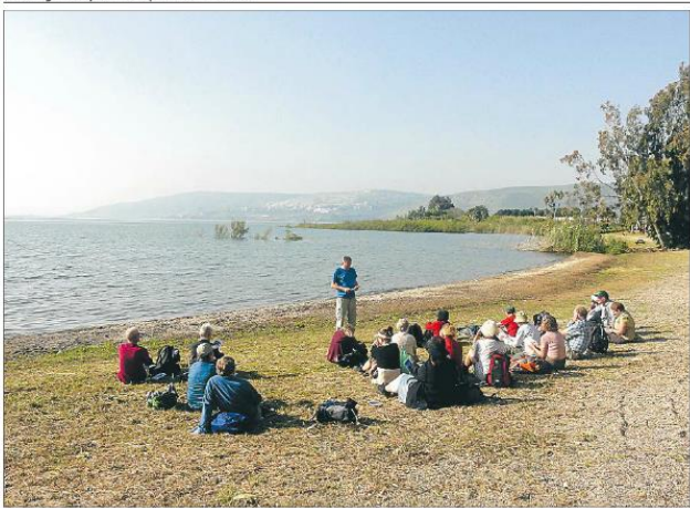
Samling ved Genesaret sø. Målet for de 65 kilometers vandring gennem Galilæas underskønne landskab er søen Genesaret, som spiller en stor rolle i fortællingerne om Jesus. Jesus boede selv i Kapernaum, en af søens daværende havnebyer. Og Simon Peter og Andreas var fiskere her, før de blev disciple af Jesus. Genesaret ligger 214 meter under havets overflade. Og er verdens laveste beliggende ferskvandsø.