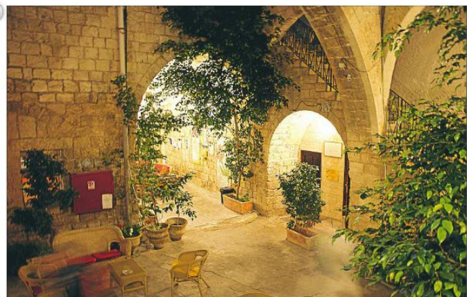
Aftenstemning i "Fauzi Azar Inn". Det første overnatningssted på vandreruten var dette orientalske hostel i et gammelt Osmannerhus, midt i den gamle by Nazareth.

For hver etape er der Bed & Breakfasts, hvor man spise og overnatte.